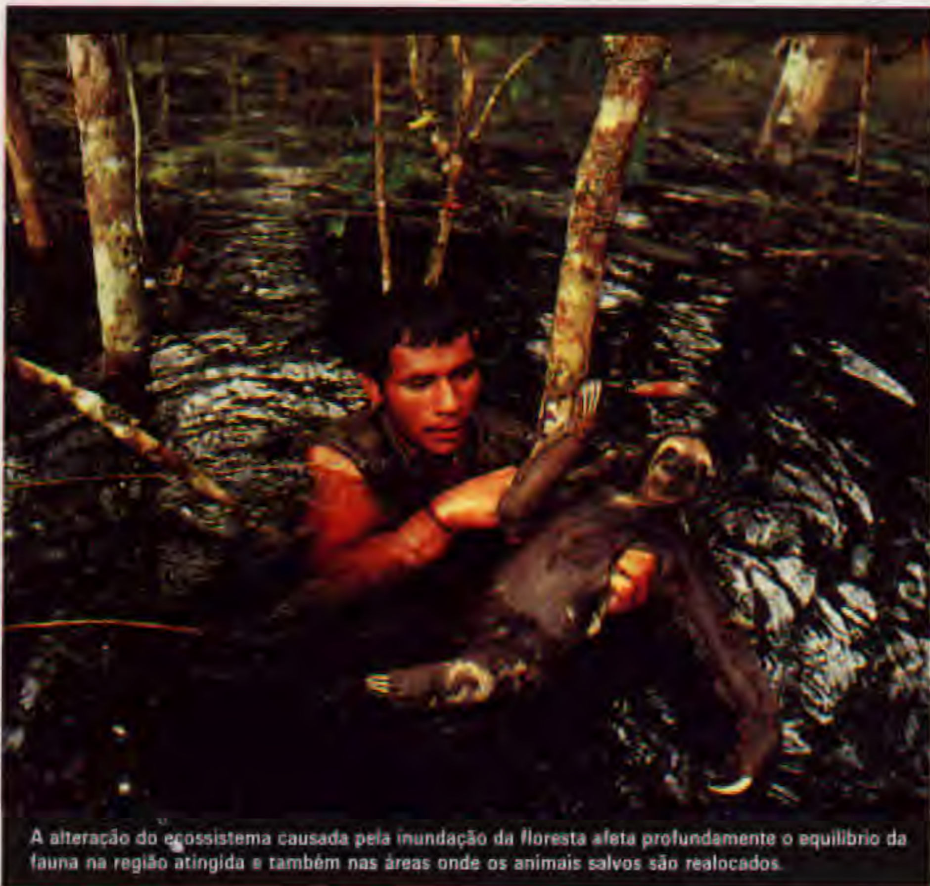
A alteração do ecossistema causada pela inundação da floresta afeta profundamente o equilíbrio da fauna na região atingida e também nas áreas onde os animais salvos são realocados.

O projeto levanta outra questão importante: até que ponto o desenvolvimento da Amazônia deve ser subsidiado pelo resto do país? Com a política de tarifa unificada para a eletricidade, a indústria e a po-