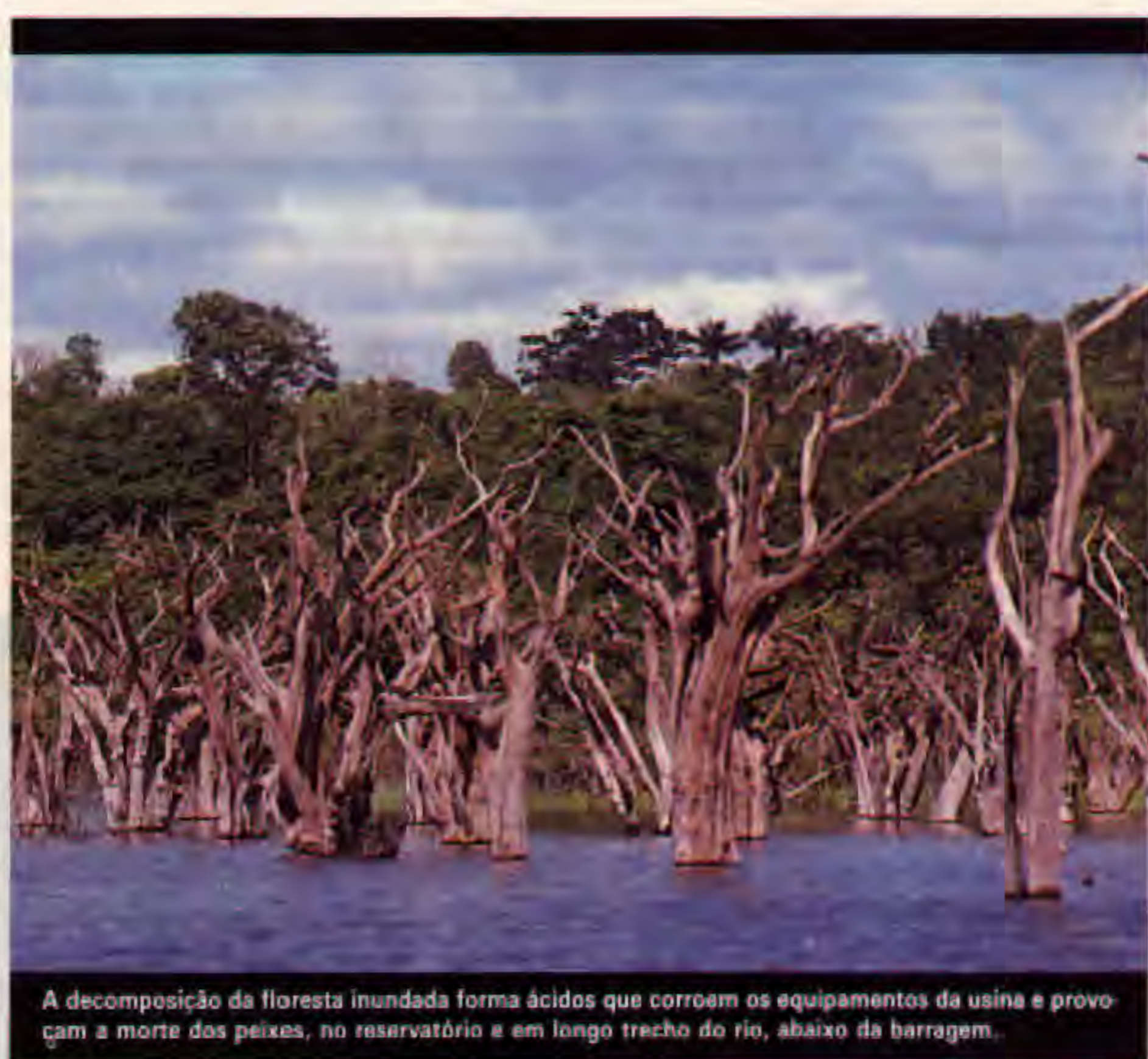
A decomposição da floresta inundada forma ácidos que corroem os equipamentos da usina e provocam a morte dos peixes, no reservatório e em longo trecho do rio, abaixo da barragem.

O grande número de canais e baias de água parada em Balbina e a decomposição da floresta inundada aumentarão ainda mais a acidez da água. Apenas 50 km 2 (2% da área inundada) foram desmatados antes do fechamento da barragem, o que gerou controvérsia jurídica, já que uma lei de 1960 (n.º 3 824) exige "a destoca e con-