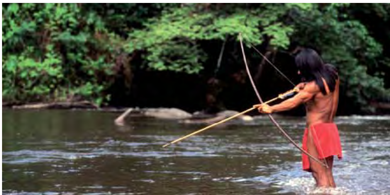
Villaggio indigeno situato al centro dell'Amazzonia

La Convenzione ONU sul Cambiamento Climatico deve raggiungere un accordo sulla definizione di "cambiamento climatico pericoloso": quando ciò accadrà il dibattito cambierà radicalmente, perché per un mondo che si è impegnato a contenere il quantitativo globale di emissioni entro una soglia limite prestabilita, le emissioni di carbonio a livello planetario diventeranno il fattore fondamentale. Senza troppo soffermarsi sulle lacune del Protocollo di Kyoto, senza preoccuparsi di chi è veramente responsabile, ma con l'unico obiettivo di ridurre il più possibile le emissioni, dovunque ciò risulti praticabile. È in questa prospettiva che la foresta acquista una particolare importanza. ■