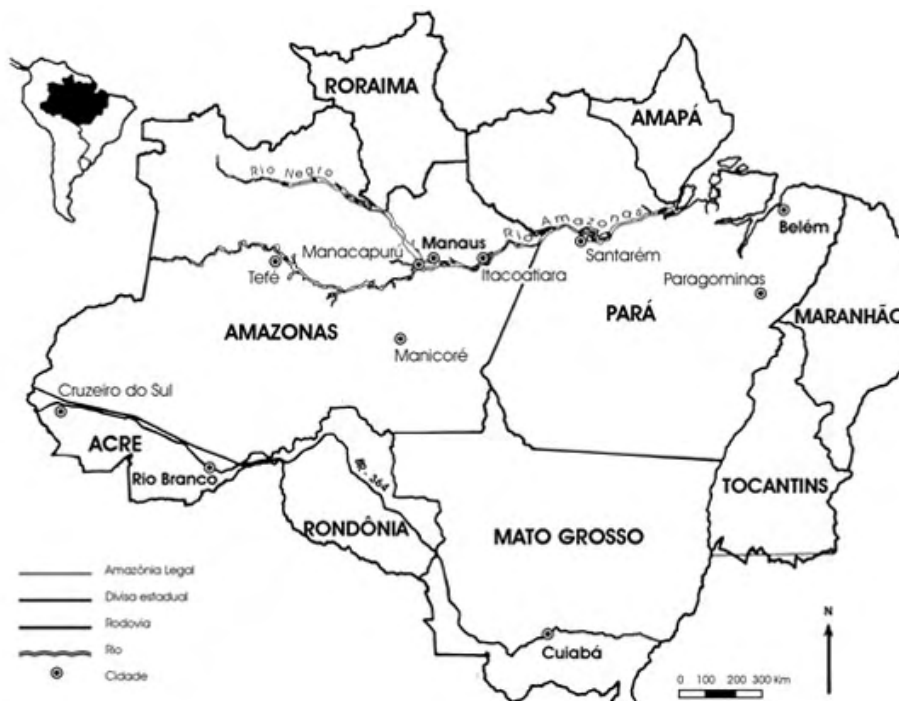
Figura 2. Estados na Amazônia Legal brasileira e cidades mencionadas no texto.

RESEX. Basear a escolha no nível de governo responsável pela terra resolveria este problema. Como é a política atual, devam ser ouvidos os representantes dos governos estaduais quando são criadas unidades de conservação federais dentro de um estado, e devam ser ouvidas as autoridades ambientais federais quando são criadas unidades estaduais. Lapsos desta política podem ter resultados desastrosos.