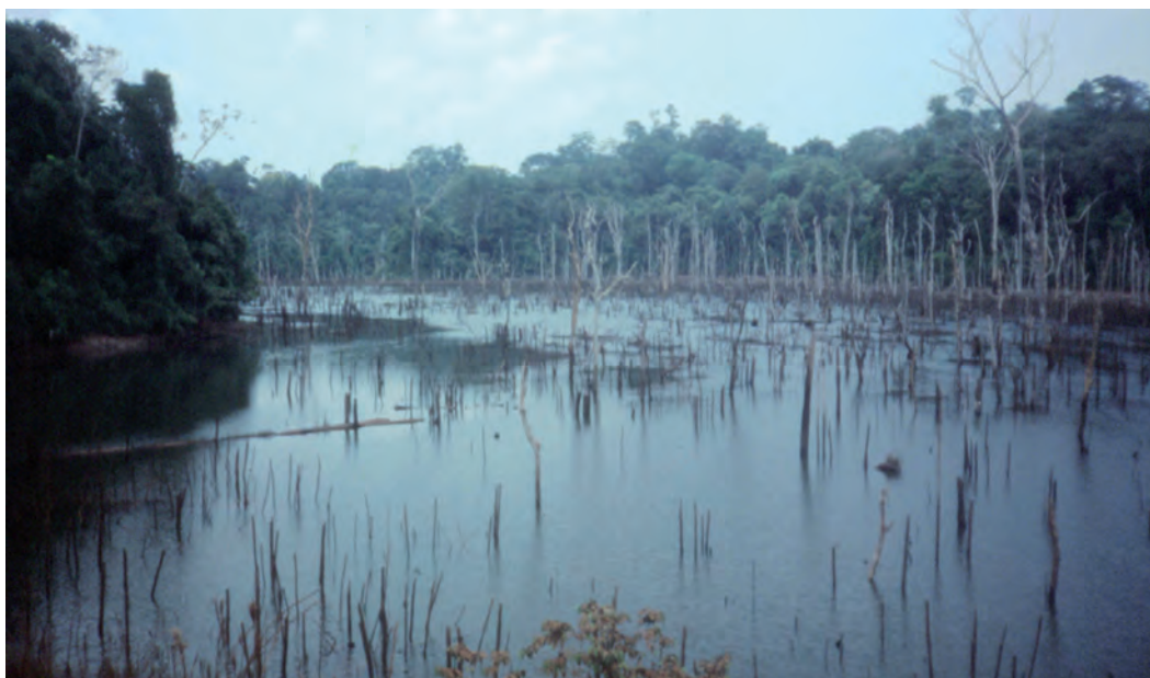
Figura 3. O braço de Caraipé do reservatório que tem um tempo de reposição de sete anos, assim levando a péssima qualidade de água com a decomposição da vegetação.

O chefe do departamento de engenharia civil da ELETRONORTE em Tucuruí afirmou que nenhuma corrosão das turbinas aconteceu, e que nenhuma turbina foi afastada ou substituída (Paulo Edgar Dias Almeida, comunicação pessoal, 1991).