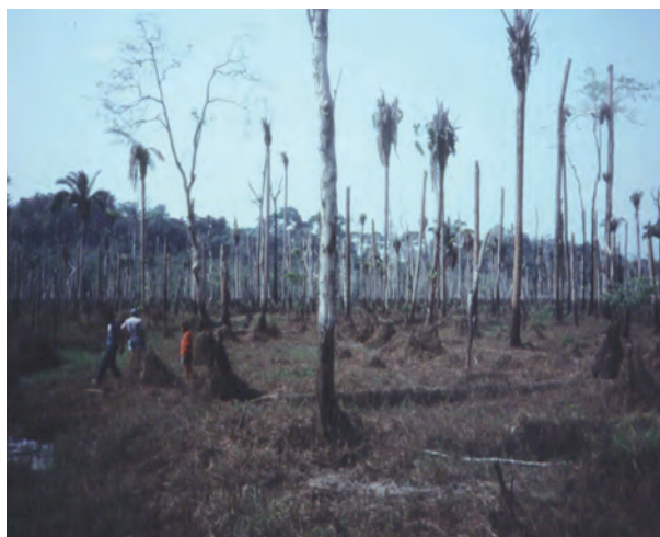
Figura 4. Deplecionamento anual expõe grandes áreas. Inundação sazonal fornece condições ideais para geração de metano, assim como também para metilação de mercúrio no solo.

Uma área grande do fundo de reservatório fica exposta sazonalmente (Figura 4). Considerando o nível mínimo operacional de 58 m acima do nível do mar para Tucuruí-I (Brasil, ELETRONORTE, 1989, p. 64), esta área ocupa 858 km 2 (Fearnside, 1995a, p. 13). Quando inundada, a área de deplecionamento tem condições ideais para geração de metano, assim como também para metilação de mercúrio no solo. No reservatório de Samuel, por exemplo, áreas como estas liberaram 15,3 g C/m 2 /ano em forma de CH 4 por ebulição, dependendo da época de inundação, comparado com 7,2 g C/m 2 /ano entre árvores mortas em pé em áreas permanentemente inundadas e apenas 0,00027 g C/m 2 /ano na calha principal (Rosa et al. , 1996c, p. 150).