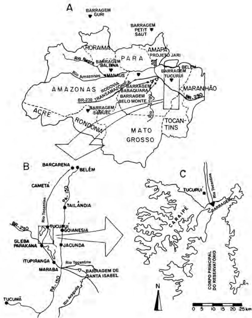
Figura 2. A: A Amazônia Legal com locais mencionados no texto, B: o Tucuruí Dam área, C: mais baixo fim do reservatório, inclusive o braço de Carapí.

de energia (Figura 2). A área de 758.000 km 2 da bacia hidrográfica a montante do local da barragem fornece um fluxo médio anual calculada em 11.107 m 3 /s (variação: 6.068-18.884 m 3 /s), com uma queda vertical de 60,8 m ao nível normal operacional de 72 m acima do nível médio do mar (Brasil, ELETRONORTE, 1989, p. 46, 51, 64). Isto contrasta com a situação em Balbina, onde uma bacia hidrográfica pequena e topografia plana resulta em um reservatório de tamanho semelhante ao de Tucuruí, mas com uma represa que gera muito menos energia. Enquanto a experiência de Balbina também contém muitas lições para o desenvolvimento hidrelétrico futuro no Brasil (Fearnside, 1989a), funcionários da ELETRONORTE freqüentemente descartam essas como irrelevantes, com base na