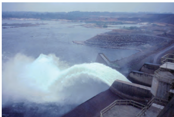
Figura 1. A Barragem de Tucuruí.

O trabalho atual revisará impactos ambientais da barragem de Tucuruí, as medidas mitigatórias que foram ou não tomadas, a maneira com que os estudos ambientais foram levados a cabo e divulgados, e o papel que estas considerações tiveram (ou não) no processo de tomada de decisões. Dado os planos ambiciosos para desenvolvimento hidrelétrico na Amazônia, muito uso poderia ser feito das lições de Tucuruí, a barragem mais poderosa da Amazônia (Figura 1).