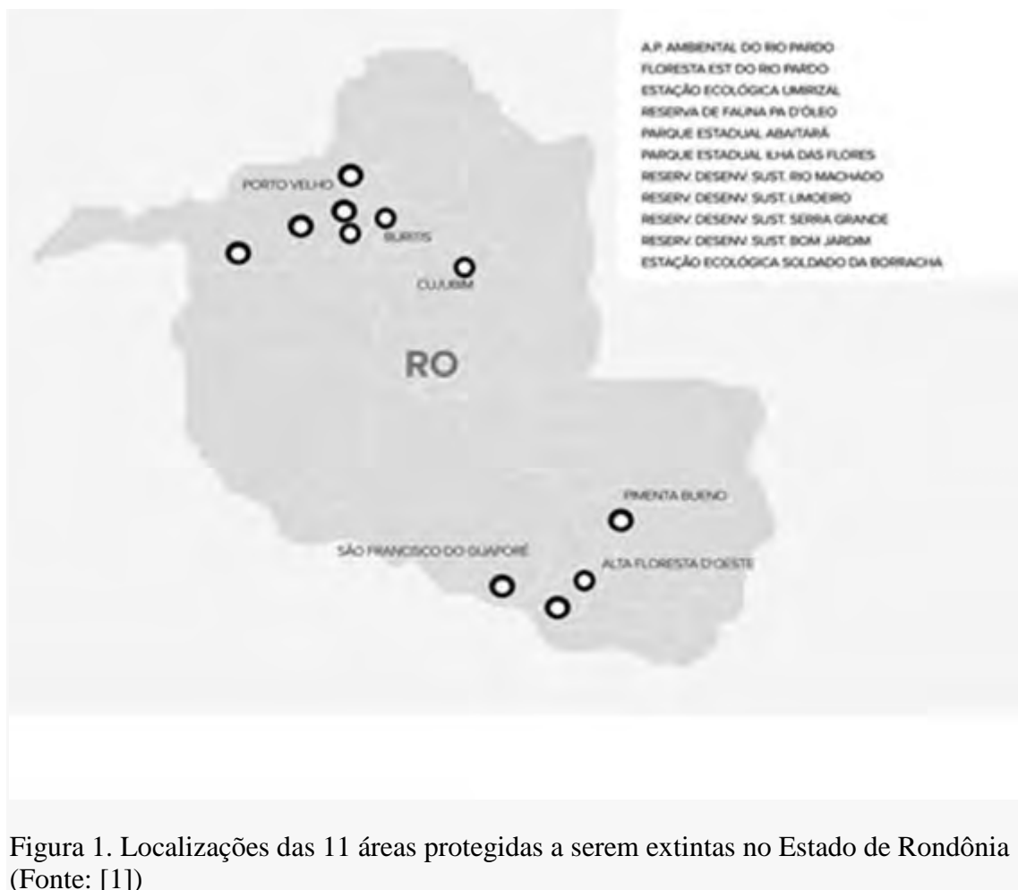
Figura 1. Localizações das 11 áreas protegidas a serem extintas no Estado de Rondônia

As onze áreas protegidas de Rondônia foram criadas pelo governador anterior em 20 de março de 2018 [2]. Uma semana depois, a Assembleia Legislativa, que é dominada por interesses do agronegócio, aprovou por unanimidade uma lei revogando as 11 reservas, mas em julho o judiciário derrubou a lei que extinguiu as reservas [3]. Nesse meio tempo, o governador que criou as reservas deixou o cargo para concorrer ao Senado Federal. De acordo com o chefe da Secretaria do Desenvolvimento Ambiental do governo estadual, os deputados estaduais chegaram a um acordo com o novo governador: eles liberariam os fundos necessários para pagar os funcionários do governo estadual se o governador aprovasse a revogação da maior reserva — a Estação Ecológica Soldados da Borracha, de 178.948 ha [4].