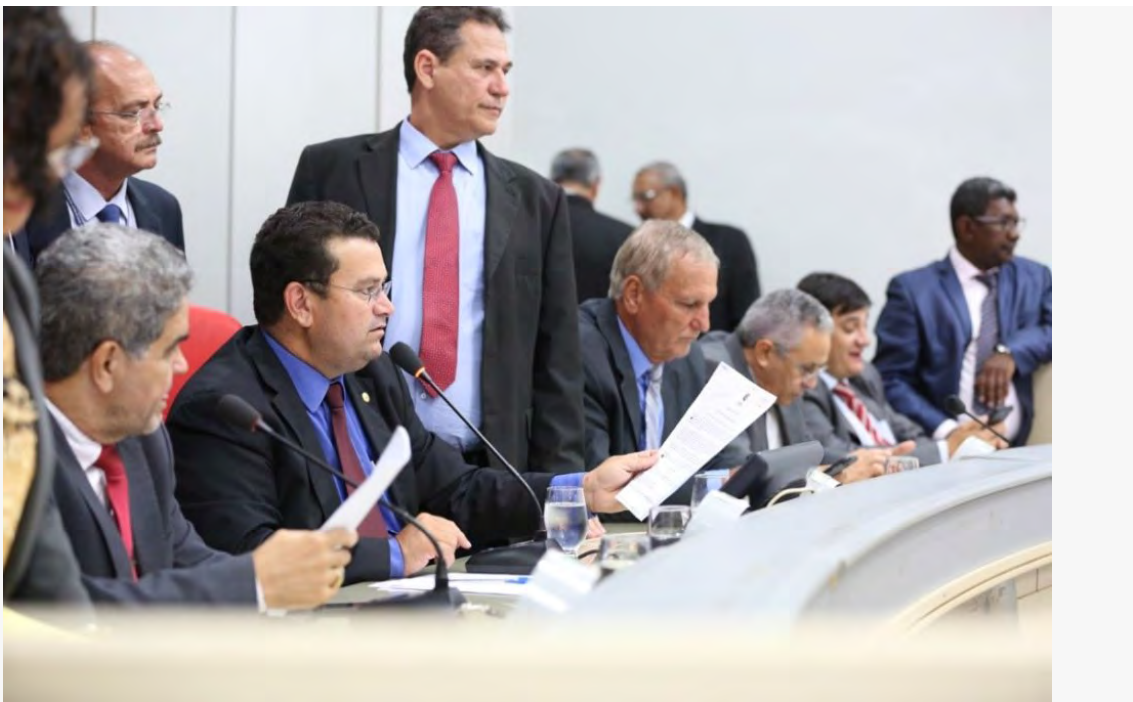
Figura 2. Legisladores em Rondônia aprovam a revogação de reservas

Em 5 de outubro, um grupo de 60 organizações não governamentais solicitou ao governador que vetasse a lei em sua totalidade [5]. Em 16 de outubro, o governador emitiu um veto parcial, aprovando a revogação da Estação Ecológica Soldados da Borracha, mas rejeitando as cláusulas que extinguem as outras dez reservas [6]. A assembleia legislativa agora tem 30 dias úteis para votar a anulação do veto [7]. Dada à unanimidade dos votos anteriores, a aprovação da extinção das reservas remanescentes está praticamente assegurada. Os tribunais podem ser os árbitros finais.