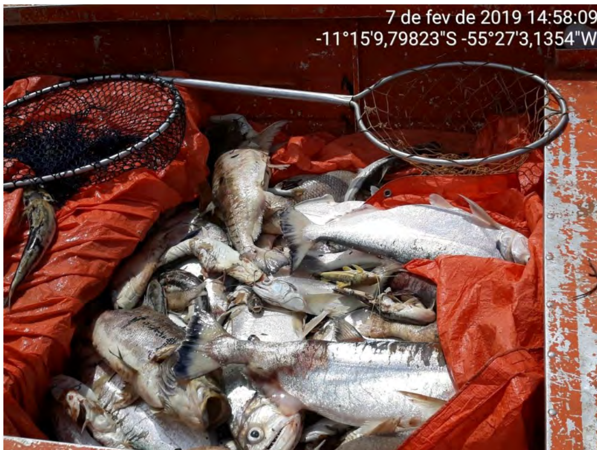
Figura 2. Peixes mortos coletados pela empresa no rio Teles Pires abaixo da barragem de Sinop em 07 de fevereiro de 2019, durante a fase de enchimento do reservatório.

foram retiradas para enterro pela empresa (Figura 2) e o restante, estimado em 8 toneladas, foi deixado no rio (Figura 3).