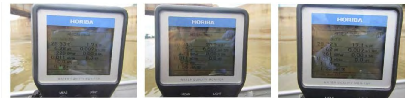
Figura 4. Medidas por Politec (Perícia Oficial e Identificação Técnica) indicando teores de 0,13, 1,32 e 1,56 mg de oxigênio dissolvido por litro na água saindo da barragem em 06 de fevereiro de 2019.

Com raras exceções, peixes não conseguem sobreviver em água com oxigênio tão baixo. A exigência de oxigênio depende da temperatura da água: quanto mais quente a água, maior o teor de oxigênio que um peixe precisa (e.g., [5]).