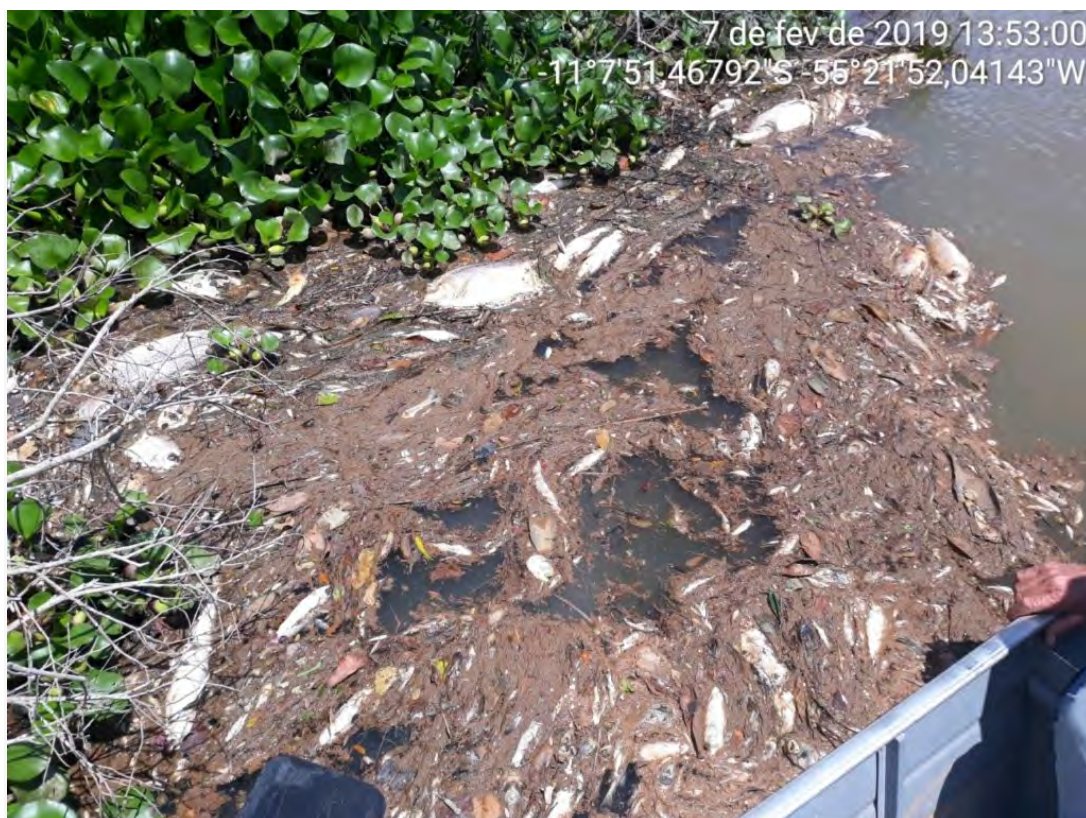
Figura 3. Peixes mortos no rio Teles Pires abaixo da barragem de Sinop em 07 de fevereiro de 2019, durante a fase de enchimento do reservatório.

A empresa hidrelétrica havia apresentado resultados de modelagem feita por consultores indicando que o teor de oxigênio no corpo principal do reservatório (a parte de onde a água é liberada rio abaixo pelos vertedouros) seria acima do padrão mínimo de 5 mg por litro fixado pela Resolução n° 357/2005 do Conselho Nacional do Meio Ambiente (CONAMA) ([2], p. 130-197; [3]).