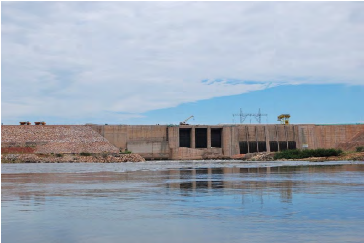
Figura 7. A barragem da UHE Sinop, vista do lado a montante com o rio no seu nível natural sem barramento. As três comportas, e, a sua direita, os dois conjuntos de três stop-logs nas entradas das duas turbinas, são todas localizadas a profundidades que tirariam água abaixo do nível da termoclina que divide a coluna d'água em um reservatório estratificado, geralmente a 2-10 m de profundidade.

A água na profundidade das entradas na UHE-Sinop teria teor elevada de metano, que seria lançado ao ar quando a água emerge em um ambiente com pressão igual a apenas uma atmosfera, abaixo da barragem. Foto: P.M. Fearnside, 13 de novembro de 2018.