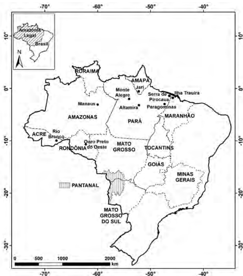
Figura 1. Mapa do Brasil com locais mencionados no texto.

A FAO, em colaboração com o Fundo de População das Nações Unidas (UNFPA) e o Instituto Internacional de Análise de Sistemas Aplicados (IIASA) estimaram a capacidade de suporte na Amazônia e em outras áreas tropicais do mundo (FAO, 1980, 1981, 1984; Higgins et al. , 1982). Vale a pena examinar o estudo da FAO/UNFPA/IIASA, uma vez que a ilusão embutida nele é de que a Amazônia pode ser transformada em um grande celeiro—uma ideia muito anterior ao estudo da FAO/UNFPA/IIASA—é um persistente e pernicioso