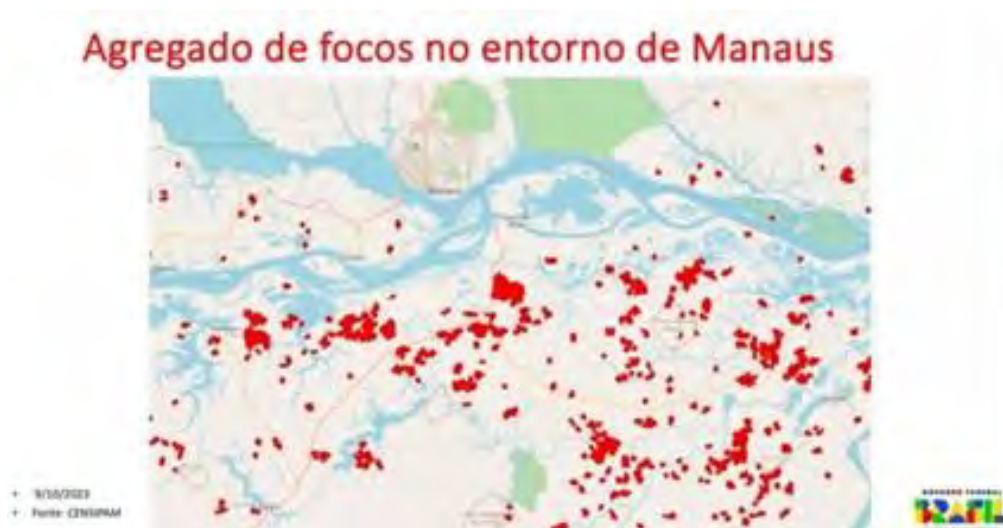
Figura 2. Locais de focos ao sul de Manaus em 2023, incluindo o Lote C [6]

A necessidade de um EIA para a reconstrução do Lote C tem sido objeto de uma longa disputa jurídica. Em 15 de dezembro de 2014, o Tribunal Regional Federal da 1ª Região (TRF1) decidiu por unanimidade que é necessária um EIA para a reconstrução do Lote C [7]. Em 28 de janeiro de 2019, o mesmo tribunal rejeitou um recurso do DNIT e reafirmou a necessidade de um EIA [8]. Simplesmente ignorando essa decisão, em 24 de junho de 2020 o DNIT lançou um edital de licitação para reconstrução de um trecho de 51,8 km dentro do Lote C, do km 198,2 ao km 250,0 [9].