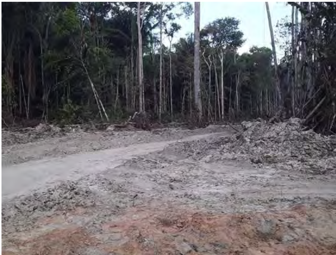
Figura 20. Ramal ilegal beirando Terra Indígena Apurinã do Igarapé São João. Foto: Cacique Waldemiro Apurinã. Outubro de 2020 (Fonte: [14]).

Em abril de 2024 a mina de potássio no município de Autazes, que impacta o grupo Indígena Mura, foi autorizada pelo governo do Estado do Amazonas sem consulta aos povos Indígenas, conforme exigido pela Convenção OIT 169 [15,16]. Isto criou o temor entre Indígenas de que este precedente pudesse ser usado como uma alavanca para permitir que o projeto da BR-319 avançasse sem consulta. [17]