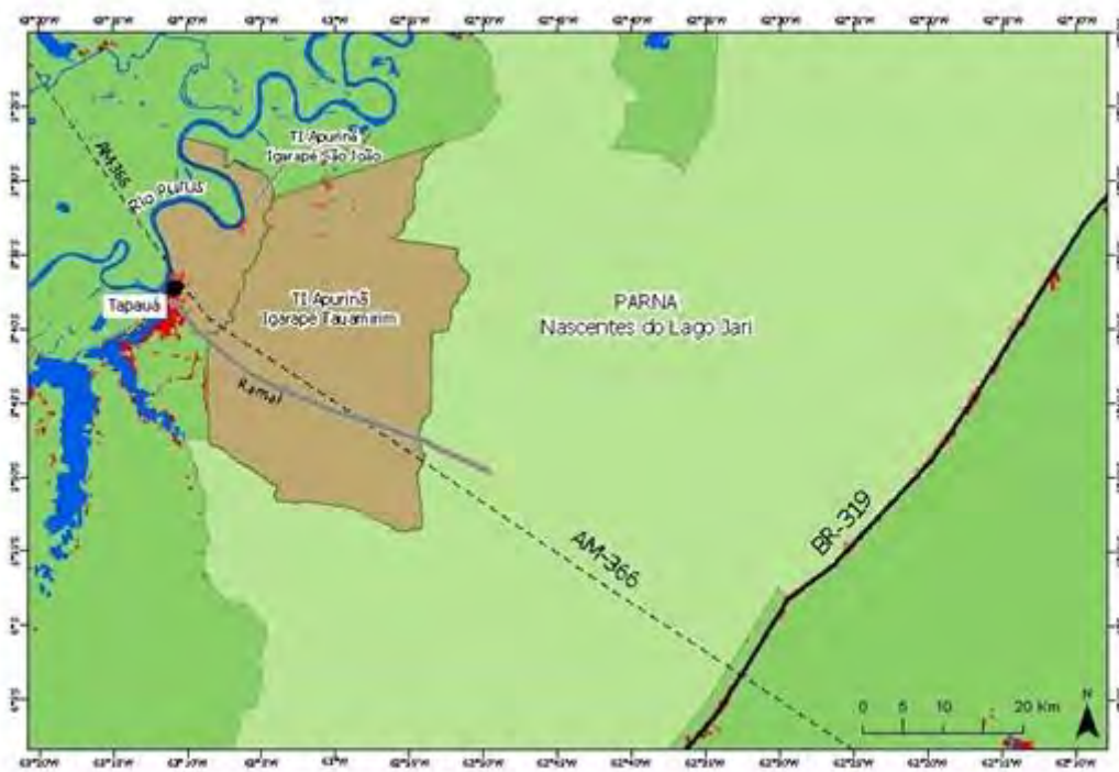
Figura 19. Localização do ramal de Tapauá, a rota planejada da AM-366, o Parque Nacional Nascentes do Lago Jari e as Terras Indígenas Apurinã do Igarapé São João e Apurinã do Igarapé Tauamirim, com desmatamento (em vermelho) até 2019 [14].

inteiro a TI Aripunã Tauamamirim (Figura 19). Segundo os Indígenas, o ramal (Figura 20) está sendo construído com máquinas da própria prefeitura de Tapauá. O acesso pelo ramal já resultou em invasões e desmatamentos por invasores não Indígenas dentro TI Aripunã Igarapé São João [14].