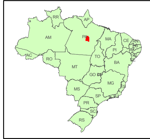
Localização da Área de Interesse